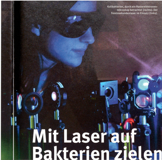
Kollibakterien, durch ein Rasterelektronenmikroskop betrachtet (rechts). Der Femtosekundenlaser im Einsatz (links).

Während sich die erste Kategorie relativ einfach von den beiden anderen unterscheiden lässt, sind Russpartikel und Bakterien aufgrund gewisser chemischer Ähnlichkeiten recht schwierig auseinanderzuhalten. Beide enthalten polyzyklische aromatische Kohlenwasserstoffe – Moleküle, die aus mehreren Ringen von Kohlenstoffatomen bestehen. In Mikroorganismen sind diesen Kohlenstoffringen allerdings Aminosäuren angehängt, die elementaren Bausteine des