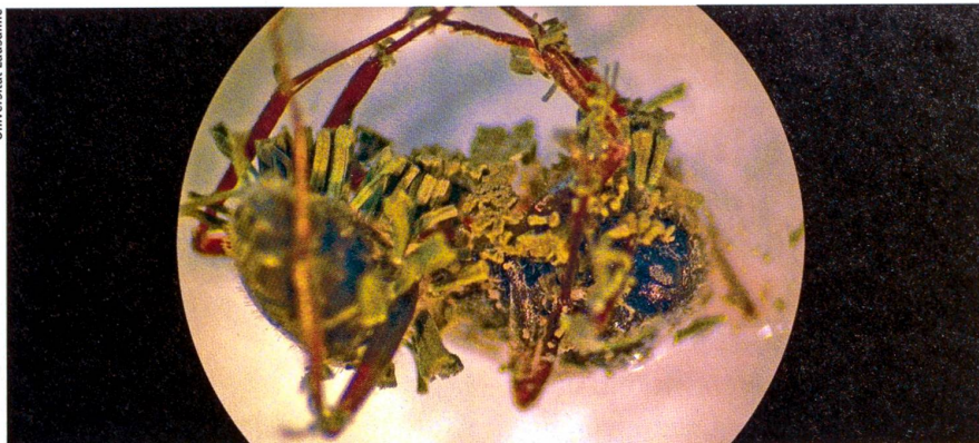
Der Parasit war stärker: Tote Ameise, vom Pilz Metarhizium anisopliae (grün) befallen.