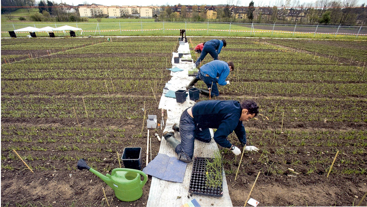
Entscheidende Gefühlsfaktoren: Von ihnen hängt die Akzeptanz neuer Technologien ab (Forschende pflanzen im zürcherischen Reckenholz gentechnisch veränderte Weizensetzlinge).