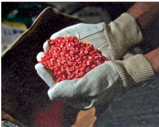
Forschung zwischen Risiko und Chance: Genveränderter Monsanto-Mais; Waschmittel mit gentechnisch hergestellten Enzymen; gentechnisch hergestelltes Human-Insulin; Labor der Syngenta (von unten nach oben).