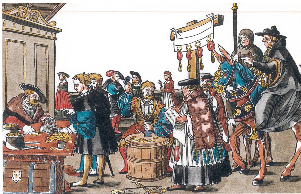
Kann gegen ein schlechtes Gewissen helfen: Ablasshandel – früher für den Vatikan (kolorierter Holzschnitt, 1510), in moderner Form etwa für klimaverträgliche Flüge.

François Walter: Catastrophes, une histoire culturelle: XVIIe-XXIe siècle . Editions du Seuil, Paris 2008.