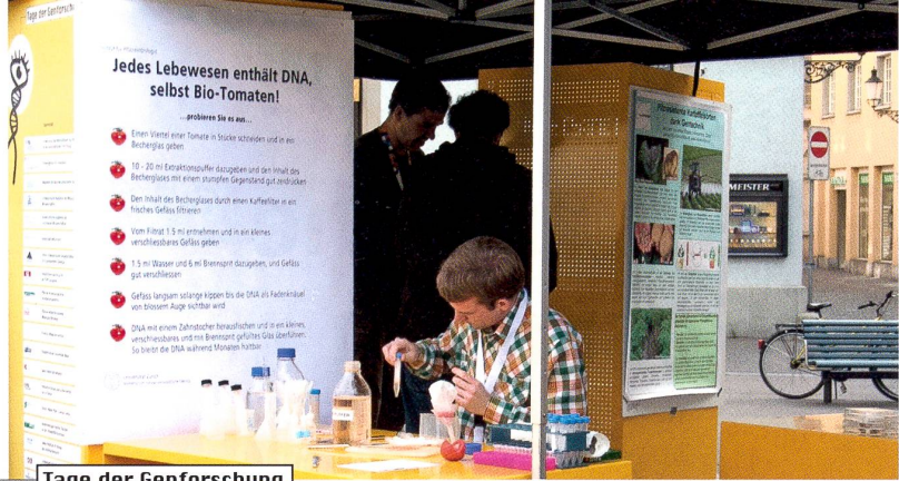
Tage der Genforschung

Frage und Antwort stammen von der SNF-Website www.gene-abc.ch , die unterhaltsam über Genetik und Gentechnik informiert.