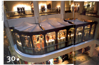
Aus den Tiefen: mehr Platz fürs Leben an der Erdoberfläche

«So unerfreulich diese Krise ist – aus der Sicht des Wissenschaftlers ist sie ein interessantes Objekt.»