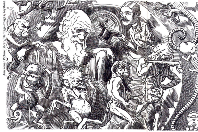
Umstrittener Kopf: Darwin in einer frühen Karikatur (1882)