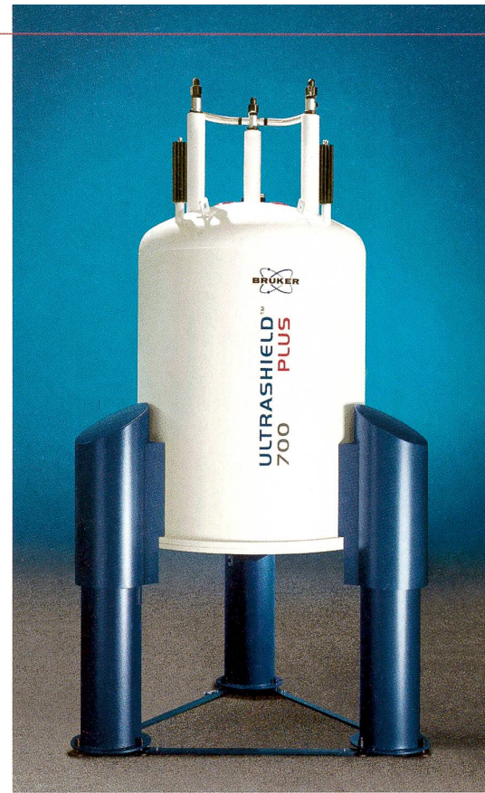
Vom Experiment zur Anwendung: Der NFS «MaNEP» schlägt eine Brücke von supraleitenden Stoffen zur Entwicklung von Kernspinresonanz-Spektrometern (rechts). Diese erleichtern die Herstellung neuer Medikamente.