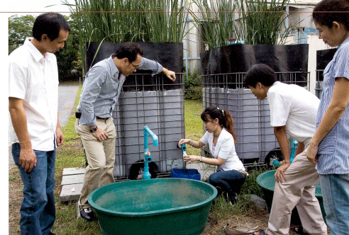
Kooperatives Netzwerk: Was für Natur- und SozialwissenschaftlerInnen gut ist (hier Forschende des NFS «Nord-Süd»), eignet sich nicht unbedingt für Geisteswissenschaftler.

In geistes- und sozialwissenschaftlichen Kreisen hält sich die Begeisterung über die NFS in Grenzen. Ein Vorwurf lautet, sie führten zu kontraproduktiven Effekten: Wer das Geld bekomme, vernetze sich nicht und überschreite auch nicht disziplinäre und universitäre Grenzen, sondern baue nur sein Gärtchen aus. Ist das grosse Instrument NFS für die