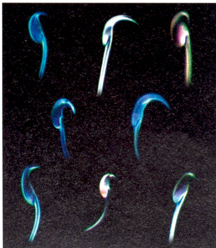
Spermienköpfe mit Haken: Je ausgeprägter diese sind, desto freizügiger sind Nagetiere beim Sex.

Abermillionen von Spermien stehen in einem gnadenlosen Wettkampf um die Befruchtung einer einzigen Eizelle. Erstaunlicherweise sind aber Spermien, die für dieses Ziel zusammenspannen, im Tierreich weit verbreitet – das Spektrum reicht von Insekten über Schnecken bis zu Schnabeltieren.