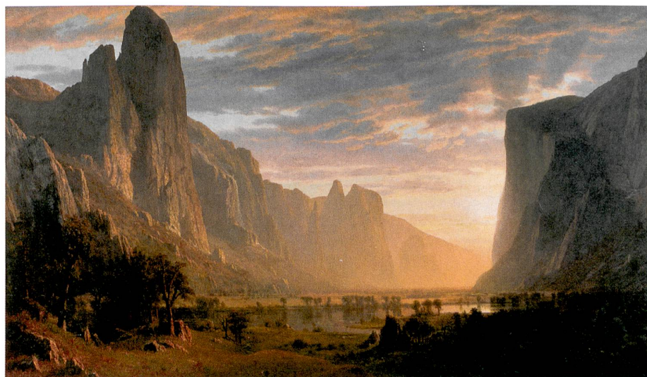
Birmingham Museum of Art, Alabama; Gift of the Birmingham Public Library

Wolf Linder, Christian Bolliger, Yvan Rielle (Hg.): Handbuch der eidgenössischen Volksabstimmungen 1848 bis 2007. Haupt-Verlag, Bern 2010, 755 S. Die Online-Datenbank swissvotes.ch bildet eine Ergänzung zum Handbuch.