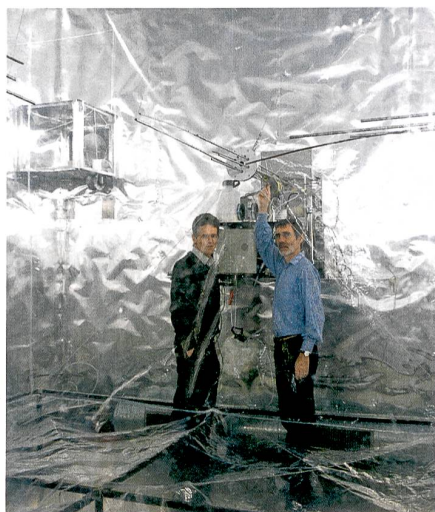
Durchblick dank Plastikbox: In der Smogkammer kann man Vorgänge in der Atmosphäre simulieren.

Es gibt zwei Arten, wie Feinstaub entstehen kann: Zum einen werden bei der Verbrennung von Öl, Benzin oder Holz direkt Russpartikel freigesetzt. Zum andern entweichen aus Kamin, Auspuff, Lösungsmitteln, aber auch dem Wald organische Gase, die sich erst in der Luft zu feinen Staubteilchen verbinden. Eine internationale Studie von 31 Forschungsinstituten unter der Co-Leitung des Paul-Scherrer-Instituts (PSI) zeigt nun, dass der Anteil dieses sekundären Feinstaubes bislang unterschätzt wurde. «Über 50 Prozent des gesamten Feinstaubes bilden sich erst in der Atmosphäre», sagt Urs Baltensperger vom PSI. Die flüchtigen Vorläuferverbindungen reagieren mit Ozon und verwandten Gasen – und lagern sich nach und nach zusammen. Innert Stunden oder Tagen entstehen so Feinstaubpartikel. Die