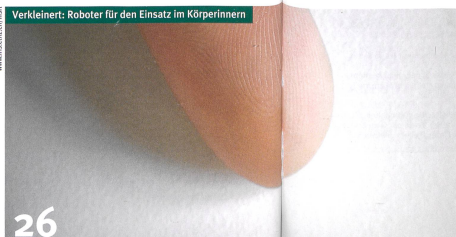
Verkleinert: Roboter für den Einsatz im Körperinnern