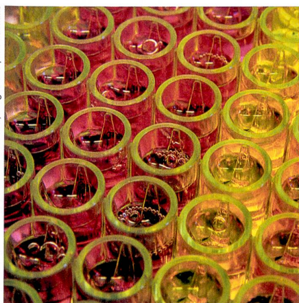
Gegen Nierenschwäche: Künstlich hergestellte Zellkulturen.