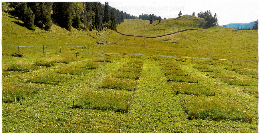
Kein Schachbrett: Versuchswiese im Jura.

wodurch die Zersetzung von Pflanzenresten, die Bodenatmung und damit die Biomassenproduktion der übrigen Arten beeinträchtigt werden. Bei Trockenheit sind die Folgen noch einschneidender. Die Forschenden zeigten zudem, dass sich die im Wurzelbereich weniger konkurrenzfähigen untergeordneten Arten zur Wasser- und Nährstoffversorgung mit Mykorrhiza-Pilzen verbinden. Vom Netzwerk unterirdischer Pilzfäden profitieren alle Pflanzen. Auch wenn die genauen Mechanismen dieser Wechselwirkungen noch nicht bekannt sind, zeigen solche Forschungsarbeiten, dass für die Widerstandskraft der Flora, besonders auch gegenüber Klimaveränderungen, jede Art zählt und zum Gleichgewicht des Ökosystems beiträgt. Mireille Pittet