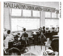
Alles eine Frage der Haltung: Mädchenerziehungsanstalt Lärchenheim, Appenzel Ausererthoden (1970).

Natalie Benelli: Nettoyeuse – Comment tenir le coup dans un sale boulot. Seismo-Verlag, Zürich 2011, 218 S.