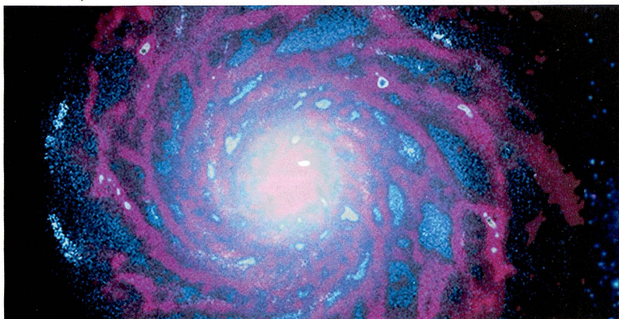
Simulierte Explosion: Im Modellbild der Milchstrasse sind die Gaswolken rot, die Sterne blau gefärbt.

Dank der richtigen Modellierung des Effekts gewaltiger Sternexplosionen, so genannter Supernovae, die Gas aus dem Zentrum der Galaxie schleudern und somit dort den Rohstoff für Sterne verknappen, konnten die Forscher auch die schlanke Struktur des Galaxienzentrums reproduzieren. Die Simulation, die zum Teil am Swiss National Supercomputing Centre bei Lugano durchgeführt wurde, nahm mehr als acht Monate in Anspruch. Leonid Leiva ■