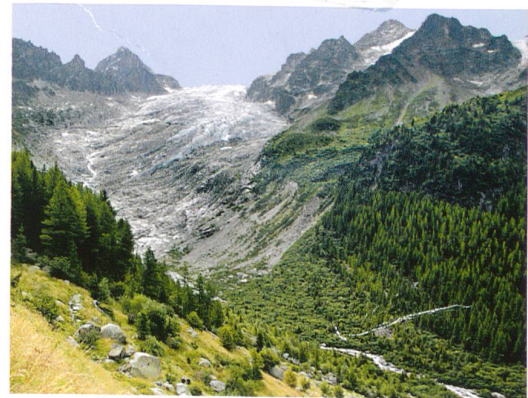
Das Klima am Werk: Der Glacier du Trient 1891 (oben) und heute (unten). Bilder: Oscar Nicollier «Glacier du Trient», 1891 / Médiathèque Valais, Martigny; Hilaire Dumoulin, 2009