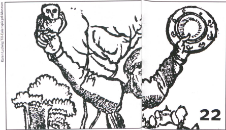
Kerstin Linder/THE KULTURKUNST MUSEUM