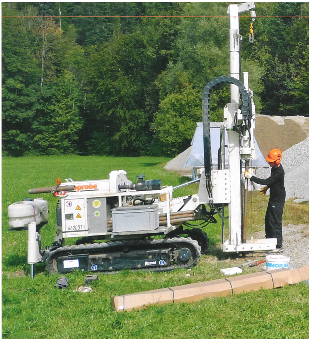
Bohren fürs Grundwasser: Installation einer Drucksonde im Emmental.

Aktuelle Klimaprognosen gehen davon aus, dass es in der Schweiz wärmer wird: Im Sommer werden weniger, im Winter dagegen mehr Niederschläge fallen. «In 100 Jahren könnte ein Sommer, wie wir ihn im Jahr 2003 hatten, die Regel sein und