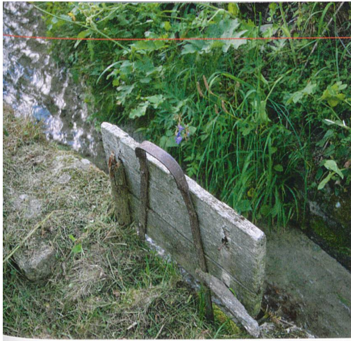
Traditionelle Bewässerung im Wallis: Die Suone «Grossa» oberhalb Birgisch (linke Seite). Oben eine Barriere, die nicht mehr in Gebrauch ist, rechts ein Wasserteiler. Seite 10: Zuerst wird die Suone gestaut, dann die Wiese berieselt.

befestigt. In diesem Wort schwingt der italienische Ausdruck für Zopf mit (treccia), denn die längs zum Kanal in die Erde eingelassenen Schieferplatten sind mit festgestampftem Gras und Moos quasi verflochten. «Hohe Handwerkskunst», sagt Rodewald. «Heute beherrschen sie nur noch ganz wenige.»