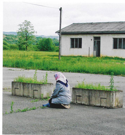
Verhöre, Vergewaltigungen: Gedenk Anlass auf dem Gelände des ehemaligen Konzentrationslagers Omarska (Mai 2005).

«Sie müssen aber dazu angeleitet werden, weil sie es nicht intuitiv können», betont Evelyne Thommen: In einer ersten, theoretischen Phase wird den Kindern erklärt, was Gefühle sind, und gezeigt, wie sich diese äussern. Die zweite Phase nutzt reale Situationen (Streit, Kummer), um die Theorie umzusetzen. Schliesslich werden sogar Freundschaften möglich. Fabienne Bogadi