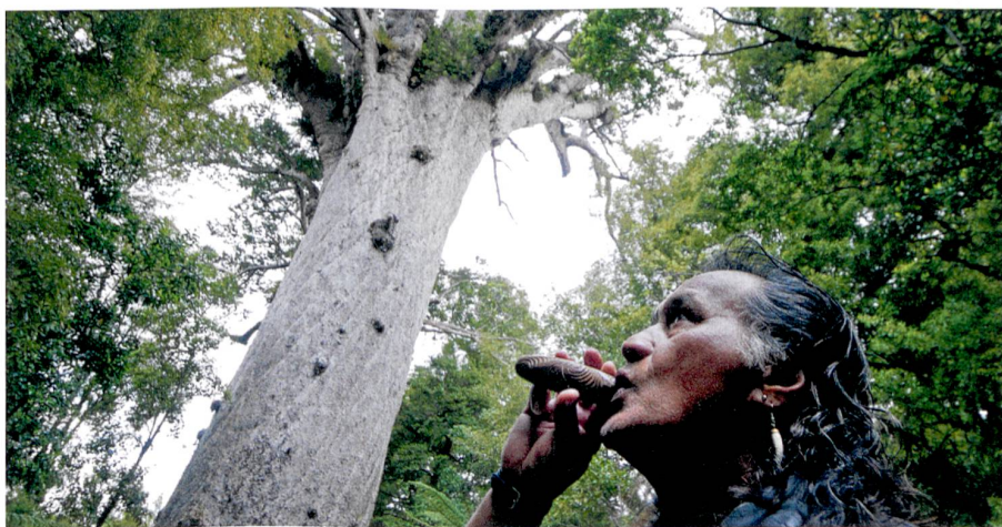
Können Pflanzen hören? Ein Angehöriger der Maori führt Besucher durch den Waipoua-Wald, ein Musikinstrument spielend (Neuseeland, 2010).