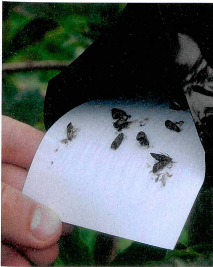
In der Falle: Apfelwickler im Flugstadium sind dem Pheromon auf den Leim gekrochen.