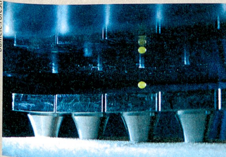
Kontaktlose Reaktionen: Die Akustophorese verstärkt die fluoreszierende Emission einer Chemikalie (grün).

D. Foresti, M. Nabavi, M. Klingauf et al. (2013): Acoustophoretic contactless transport and handling of matter in air. Proceedings of the National Academy of Sciences of the United States of America (doi:10.1073/pnas.1301860110/-/DCSupplemental).