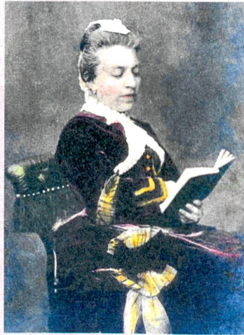
Emanzipativ: Die polnische Schriftstellerin Eliza Orzeszkowa (Fotografie um 1904).