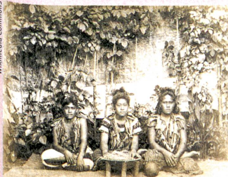
Teil des Alltags: Drei Frauen bereiten auf einer Samoainsel Kava zu (um 1890).

C.B. Graber, K. Kuprecht, J.C. Lai (Hg.): International Trade in Indigenous Cultural Heritage . Edward Elgar, Cheltenham, Northampton 2012. 509 S.