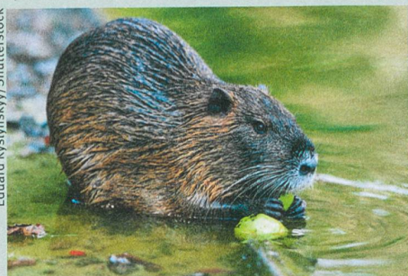
Auch die Bisamratte ist unerwünscht.

Tim M. Blackburn et al. (2014): A Unified Classification of Alien Species Based on the Magnitude of their Environmental Impacts. PLoS Biology 12: e1001850.