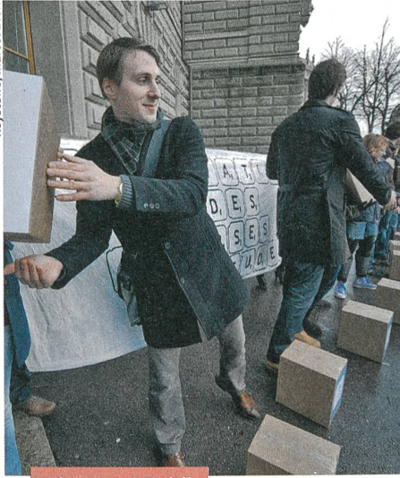
Wissen und Politik