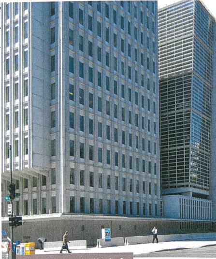
Kultur und Gesellschaft