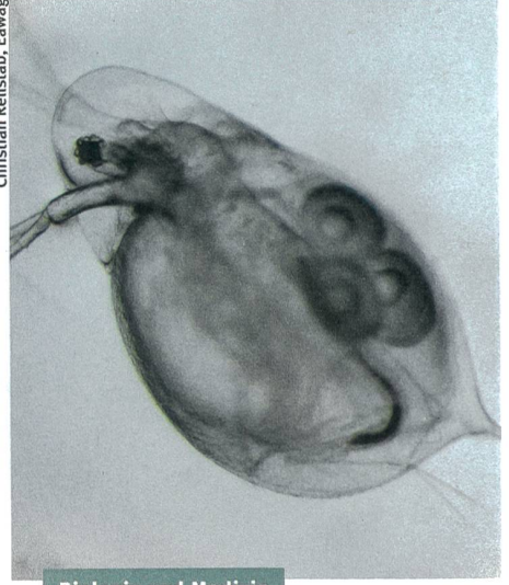
Biologie und Medizin