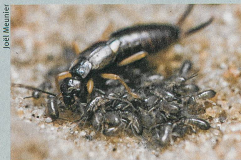
Ein Ohrwurmweibchen pflegt seine Jungen.

J.W.Y. Wong, C. Lucas & M. Kölliker (2014): Cues of Maternal Condition Influence Offspring Selfishness. PLoS ONE 9: e87214.