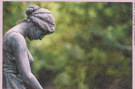
Vulnerabilitätseffekt: Grosse Selbstzweifel stimmen auf die Dauer unfroh.

U. Orth, R.W. Robins (2013): Understanding the link between low self-esteem and depression. Current Directions in Psychological Science 22: 455-460.