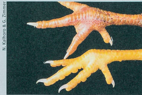
Die Hühnerkrallen oben sind von der Vogelgrippe gezeichnet, die unten sind gesund.