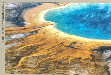
Wo einst ein Supervulkan ausbrach, hat sich ein kleiner See gebildet (Yellowstone Nationalpark).

W.J. Malfait et al. (2014): Supervolcano eruptions driven by melt buoyancy in large silicic magma chambers. Nature Geoscience 7, 122–125.