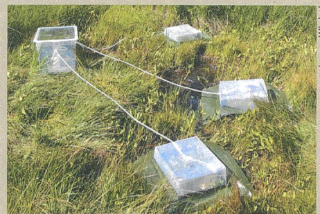
Schwefelfalle: Versuchsaufbau an der Gola di Lago im Tessin.