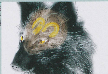
Stress wird nicht nur bei Füchsen im Hippocampus geregelt.