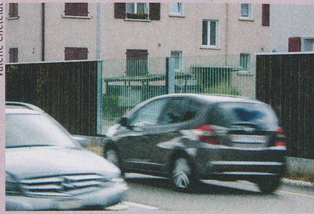
Das soziale Umfeld und Vorbilder bestimmen mit, ob jemand leise fährt.