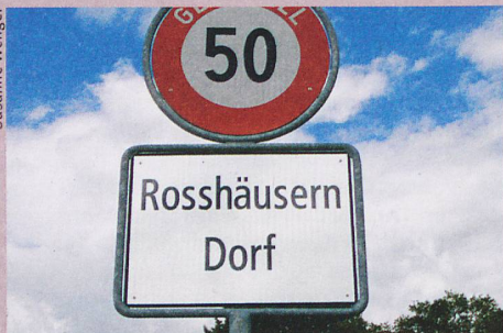
Mit Pferden hat die Ortschaft nichts am Hut, ihren Namen hat sie von einem Mann.

Ortsnamenbuch des Kantons Bern, Band 5 erscheint in Herbst 2015 im Verlag A. Francke, Basel und Tübingen.