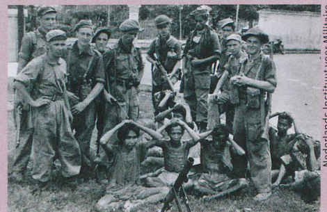
Niederländische Soldaten posieren auf Java mit einer Gruppe indonesischer Kriegsgefangener.

R. Limpach: Business as usual: Dutch mass violence in the Indonesian war of independence 1945–49, in: B. Luttikhuis et al. (Eds.): Colonial Counterinsurgency as Mass Violence. The Dutch Empire in Indonesia. Routledge, New York, 2014