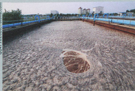
In verdünntem Klärschlamm wachsen Antibiotika-resistente Bakterien besonders gut.

B. Ricken et al.: Degradation of sulfonamide antibiotics by Microbacterium sp. strain BR1 – elucidating the downstream pathway. New Biotechnology (2015)