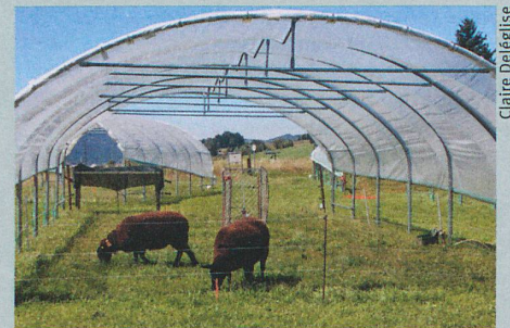
Mit dem Gewächshaustunnel simulierten die Forscher einen sehr trockenen Sommer.

C. Deléglise et al.: Drought-induced shifts in plants traits, yields and nutritive value under realistic grazing and mowing managements in a mountain grassland. Agriculture, Ecosystems & Environment (2015)