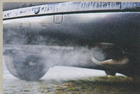
Das Ziel: weniger Russ in den Abgasen.