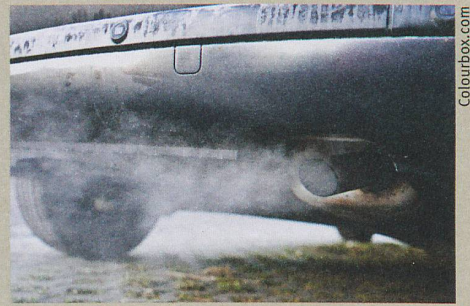
Das Ziel: weniger Russ in den Abgasen.