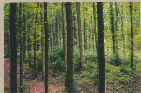
Die Zusammensetzung des Waldes – hier mit vielen Buchen – wird sich mit dem Klima ändern.

N. Bircher: To die or not to die: Forest dynamics in Switzerland under climate change. Ph.D. Thesis, ETH Zurich (2015)