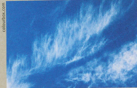
Zirren wirken wie mit feinen Pinselstrichen gemalt. Ihr Einfluss aufs Klima ist aber beachtlich.