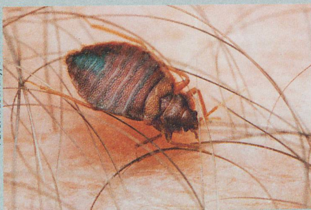
Ungemütliche Bettgenossen: Die Blutsauger werden immer resistenter gegen Insektizide.