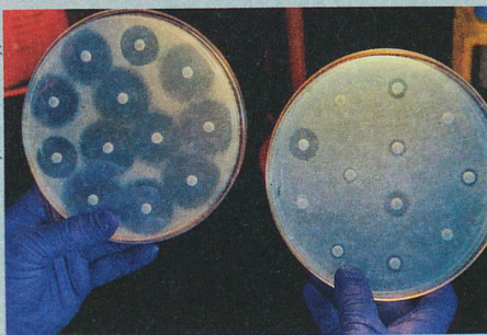
Multiresistente Bakterien (rechts) halten eine wachsende Zahl von Antibiotika in Schach.