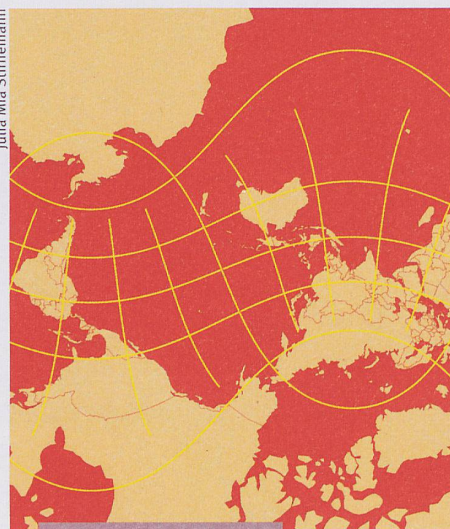
Kultur und Gesellschaft