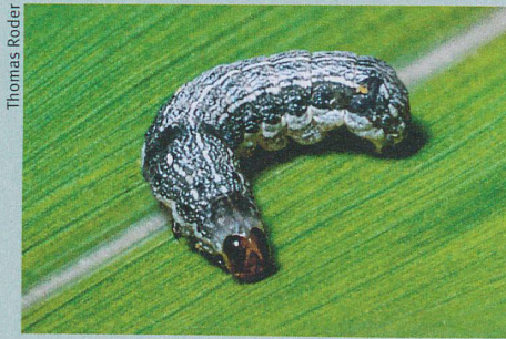
Gegen den Baumwollwurm und andere Feinde muss die Pflanze ihre Abwehrkräfte einteilen.