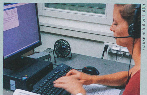
Mit gezielten Fragen werden unbehandelte psychische Leiden entdeckt.

C. Michel et al.: Demographic and clinical characteristics of diagnosed and non-diagnosed psychotic disorders in the community. Early Intervention in Psychiatry (2016)