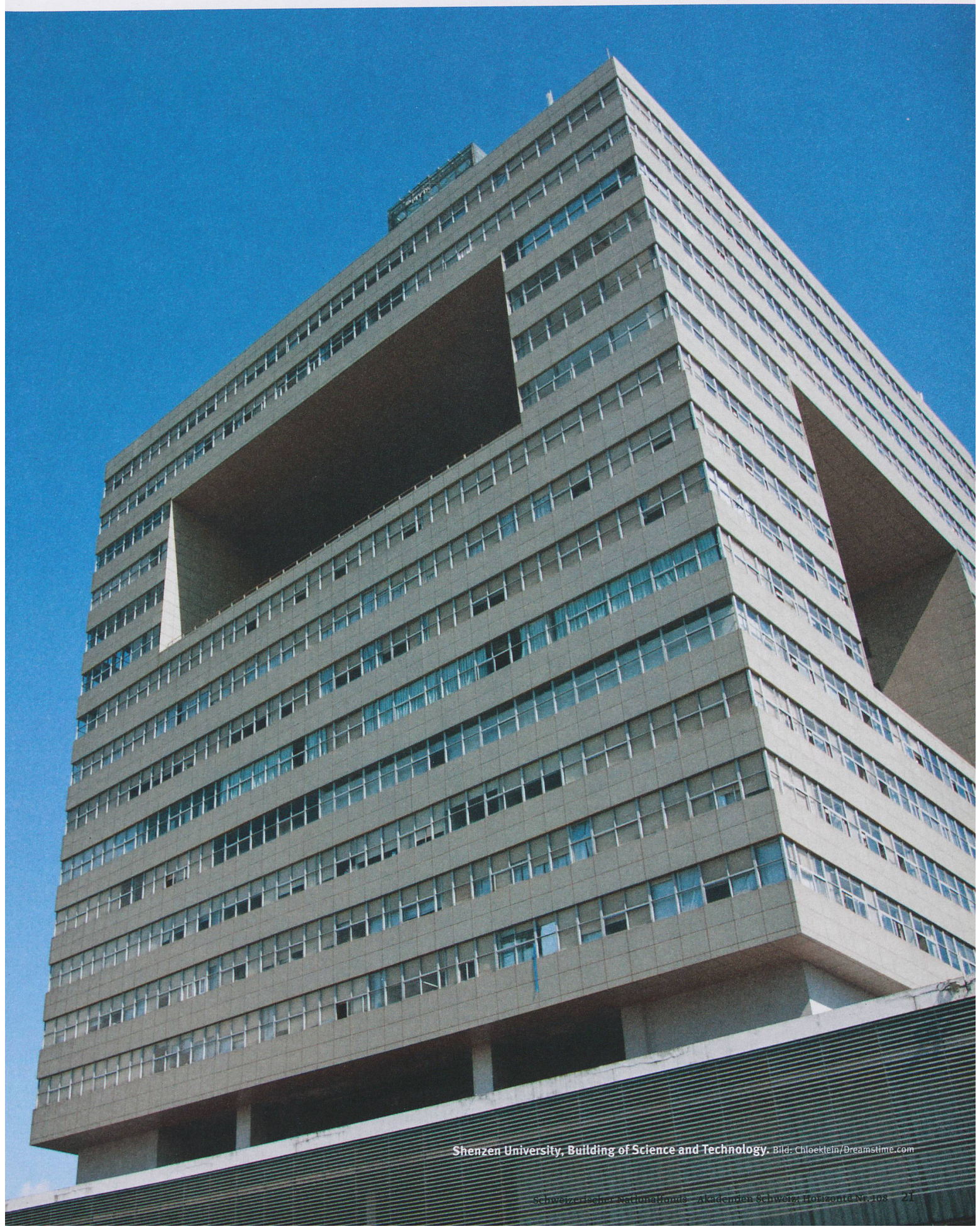
Shenzen University, Building of Science and Technology.