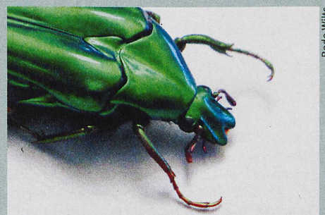
Nanostrukturen im Panzer erzeugen das schimmernde Grün des Rosenkäfers.

L. T. McDonald et al: Circularly polarized reflection from the scarab beetle Chalcothea smaragdina : light scattering by a dual photonic structure. Interface Focus (2017)