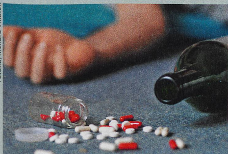
Ein erschwerter Zugang zu Medikamenten könnte Suizide verhindern.

P. Pfeifer et al.: Acute and chronic alcohol use correlated with methods of suicide in a Swiss national sample. Drug and Alcohol Dependence (2017)