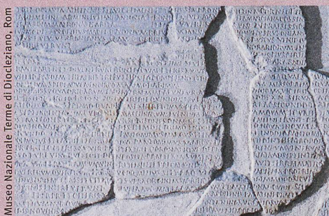
Museo Nazionale Terme di Diocleziano, Rom

B. Schnegg, Commentaria ludorum saecularium , De Gruyter (erscheint 2019)