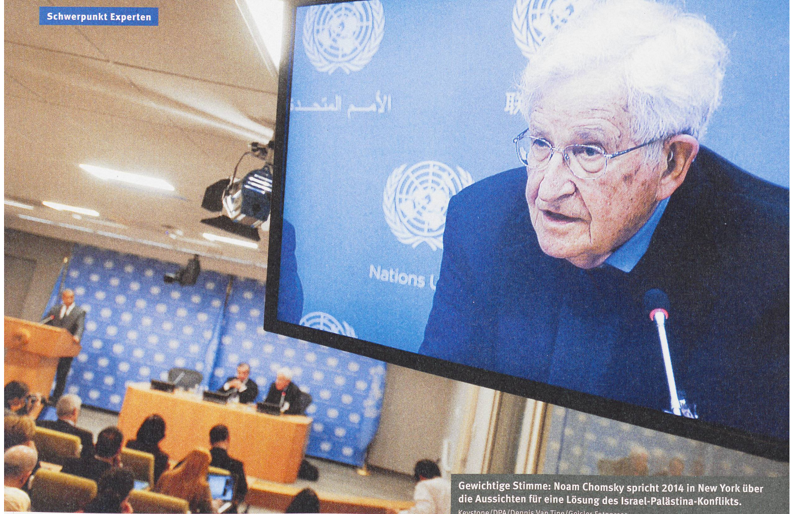
Gewichtige Stimme: Noam Chomsky spricht 2014 in New York über die Aussichten für eine Lösung des Israel-Palästina-Konflikts.