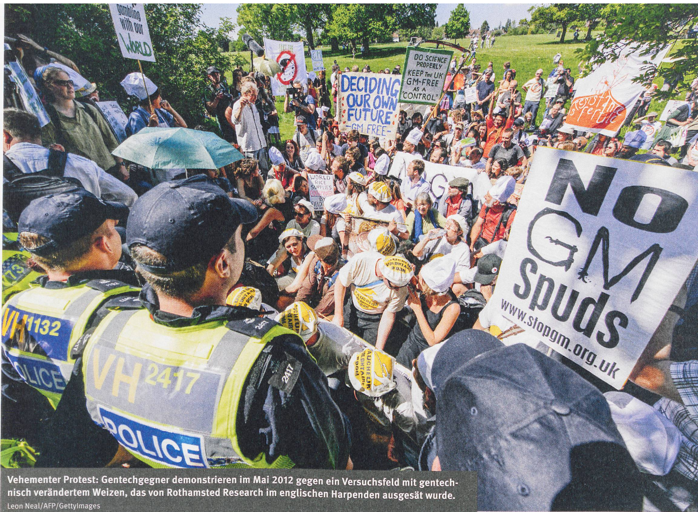
Vehementer Protest: Gentechgegner demonstrieren im Mai 2012 gegen ein Versuchsfeld mit gentechnisch verändertem Weizen, das von Rothamsted Research im englischen Harpenden ausgesät wurde.