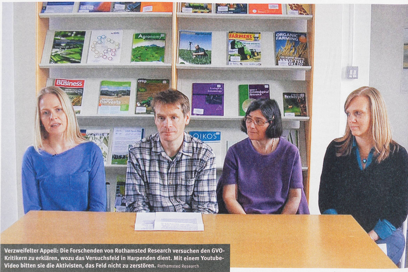
Verzweifelter Appell: Die Forschenden von Rothamsted Research versuchen den GVO-Kritikern zu erklären, wozu das Versuchsfeld in Harpenden dient. Mit einem Youtube-Video bitten sie die Aktivisten, das Feld nicht zu zerstören. Rothamsted Research