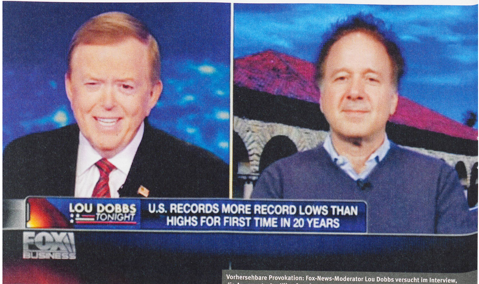
Vorhersehbare Provokation: Fox-News-Moderator Lou Dobbs versucht im Interview, die Argumente des Klimaforschers Ken Caldeira ins Lächerliche zu ziehen. Screenshot