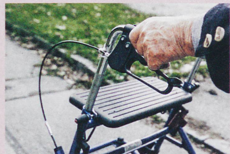
Manche Senioren lehnen den Rollator ab, weil sie dem Bild der fiten Alten entsprechen wollen.

F. Rickli: Old, disabled, successful? Transfigurations of aging with disabilities in Switzerland. In: Medical Anthropology Theory (in preparation).