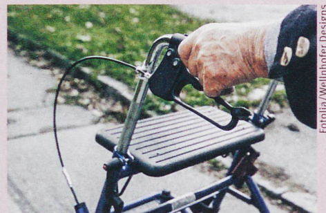
Manche Senioren lehnen den Rollator ab, weil sie dem Bild der fiten Alten entsprechen wollen.

F. Rickli: Old, disabled, successful? Transfigurations of aging with disabilities in Switzerland. In: Medical Anthropology Theory (in preparation).