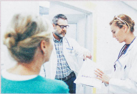
Fehler vermeiden: Vorgesetzte sollten die Mitarbeitenden um ihre Meinung fragen.