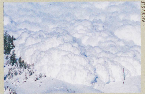
Arbaz im Wallis: Ein neues Radargerät durchschaut künstliche Staublawinen.