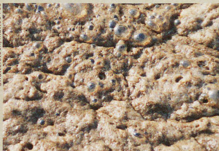
Welche Prozesse bei der Verbrennung von Klärschlamm ablaufen, wurde neu genau erfasst.