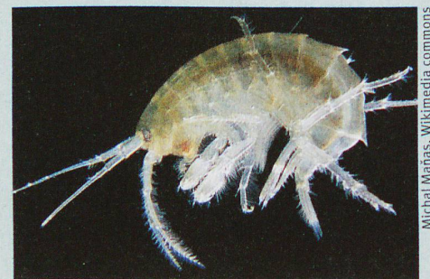
Bachflohkrebsen sind äusserst empfindlich auf gewisse Pestizide.

N. A. Munz et al.: Internal Concentrations in Gammarids Reveal Increased Risk of Organic Micropollutants in Wastewater-Impacted Streams. Environmental Science & Technology (2018)