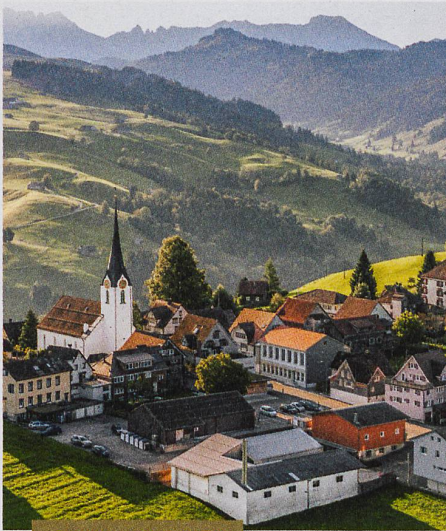
Umwelt und Technik