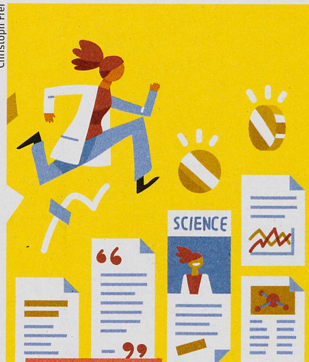
Wissen und Politik