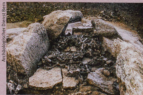
In Oberbipp (BE) wurden diese 5000 Jahre alten menschlichen Knochenfragmente gefunden.

Siebke et al.: Who lived on the Swiss Plateau around 3300 BCE? Analyses of commingled Human Skeletal Remains from the Dolmen of Oberbipp. International Journal of Osteoarchaeology (2019)